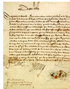
Lettre d'Henri IV

En option : soirée au théâtre des Célestins