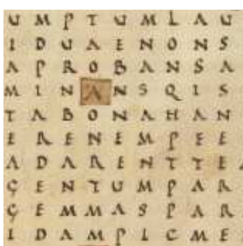
Raban Maur, La Louange à la sainte croix , BnF, dépt. des Manuscrits.